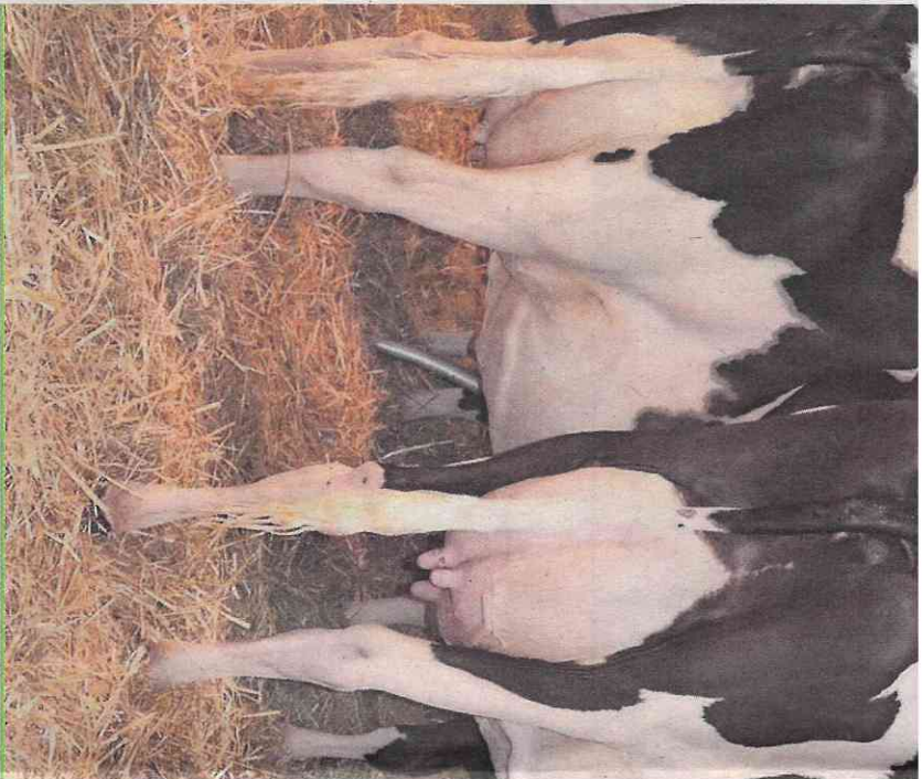
Le but de Kometian est d'améliorer la santé animale par le renforcement du système immunitaire tout en réduisant l'utilisation d'antibiotiques.

La demande d'intégrer Kometian dans le programme des projets de ressources a été soumise à l'Office fédéral de l'agriculture et a été approuvée